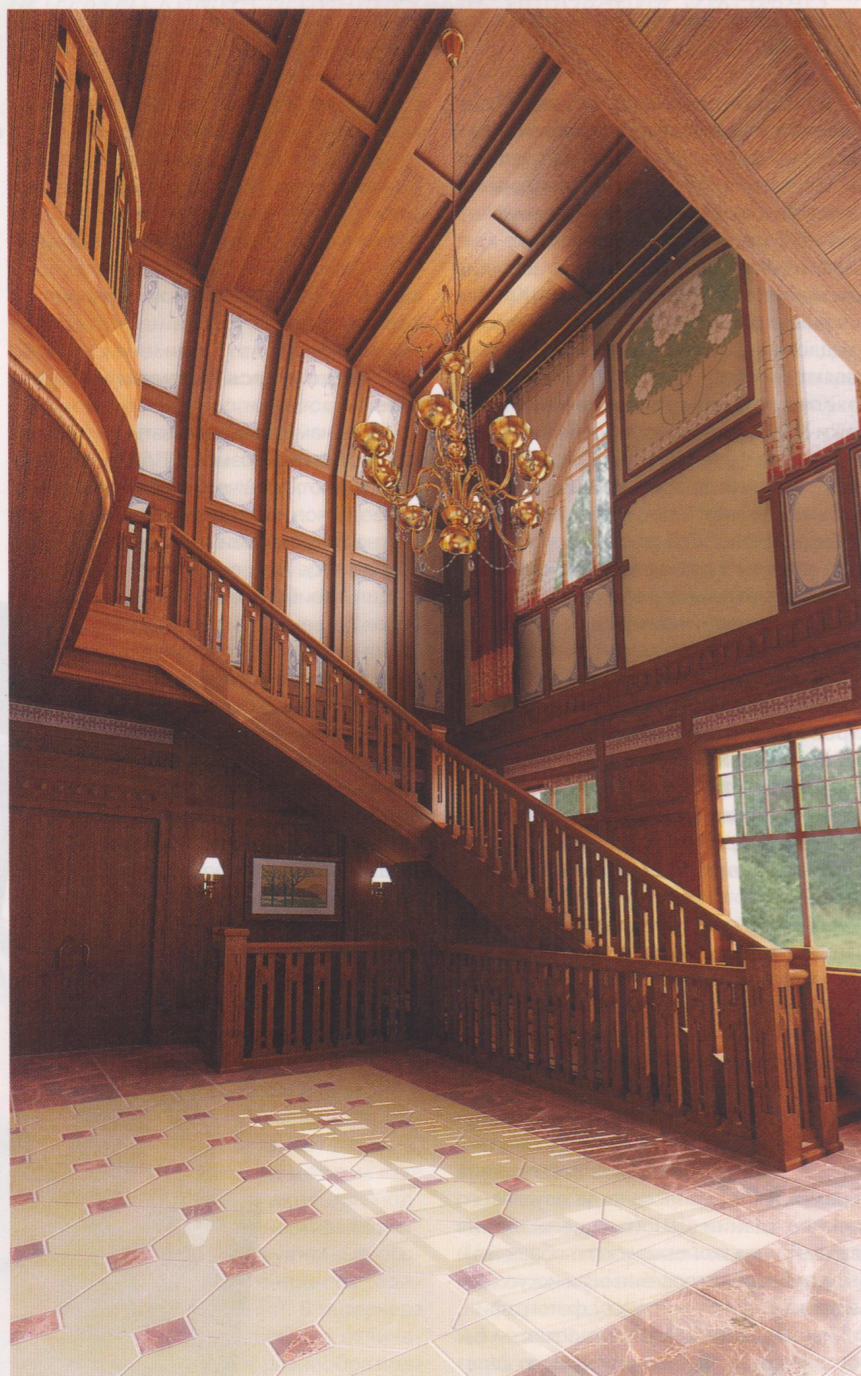
«СТРОИТЕЛЬСТВО И ГОРОДСКОЕ ХОЗЯЙСТВО» № 118, 2010

– Концепция внутреннего оформления каждого из особняков основывалась на соблюдении стилистики здания и композиции в целом, поскольку исторические документы сохранились только по особняку Мельцера.